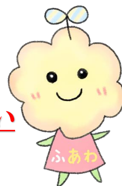
とくしま子どもの居場所づくり キャラクター「ふあわ」

徳島県社会福祉協議会に「子どもの居場所づくり推進コーディネーター」を配置し、地域における子どもの居場所づくりを支援しています。